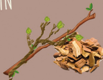
BRANCHAGES & COPEAUX DE BOIS